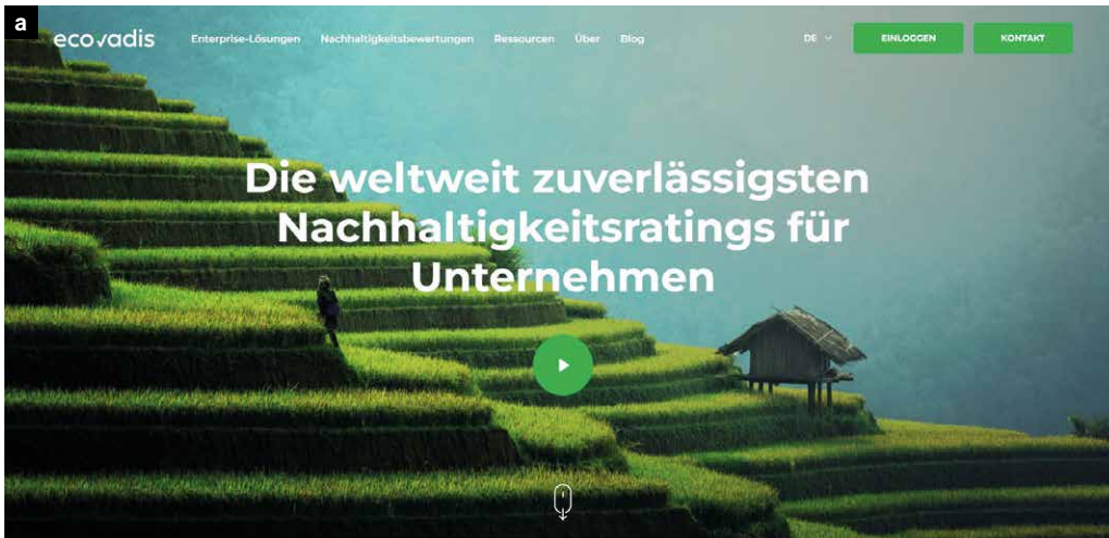
Anbieter wie EcoVadis und Innolytics erstellen für Unternehmen ein Compliance-Profil.

dig. Und weil außerhalb von Deutschland niemand das Siegel kennt, hat es sich bislang nicht in großem Stil durchgesetzt.