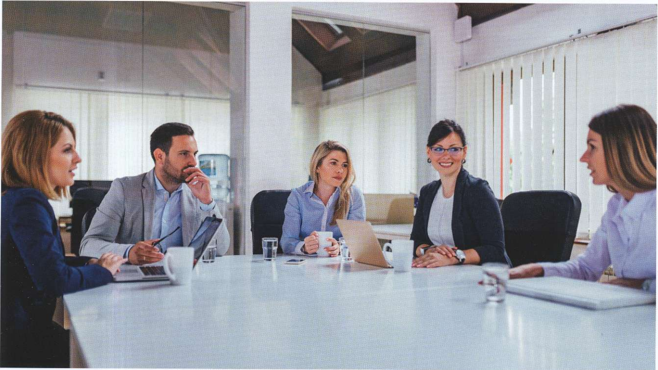
Eine Führungskraft, die sich nur hinter ihrem Schreibtisch und Aktenbergen verbirgt, wird nie ein Influencer, denn eine Voraussetzung hierfür ist: Man muss die Kommunikation mit den Netzwerkpartnern suchen

cer im Netz ist, so banal dies klingt: Sie sorgen dafür, dass sie sichtbar sind - zum Beispiel, indem sie regelmäßig ihre Social-Media-Kanäle füttern und ihr virtuelles Netzwerk pflegen. Ähnliches gilt für alle Personen, die Influencer sind oder sein möchten. So fällt zum Beispiel auf, wie oft unsere Spitzenpolitiker seit Ausbruch der Corona-Pandemie nach einem anstrengenden Arbeitstag abends noch in Fernseh-Talkshows sitzen, um ihr Denken und Handeln der Bevölkerung zu vermitteln und zu erreichen, dass diese ihre Entscheidungen mitträgt. Das heißt, eine Führungskraft, die sich nur hinter ihrem Schreibtisch und Aktenbergen verbirgt, wird nie ein Influencer, denn eine Voraussetzung hierfür ist: Man muss die Kommunikation mit den Netzwerkpartnern suchen. Das gilt in besonderem Maße für Physiotherapeuten, da diese sich aufgrund ihrer Arbeitsstruktur seltener sehen. Führungskräfte sollten also darauf achten, präsent zu sein.